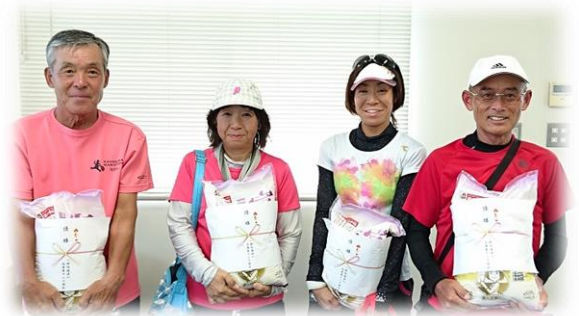
わくわくうきうき